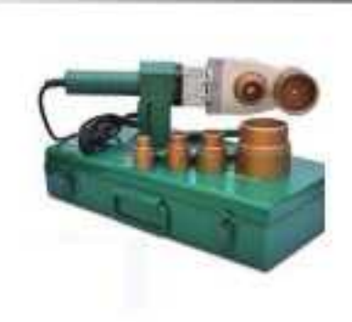
Máy hàn ống nhiệt