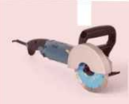
Máy cắt bê tông