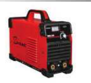
Máy hàn điện