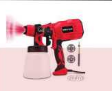
Máy phun sơn