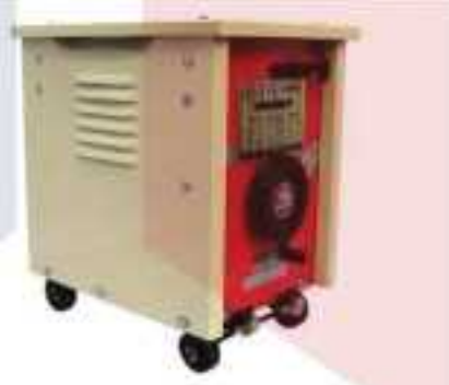
Máy hàn mix